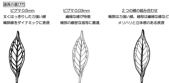
図3 参加者に配布した資料の一部抜粋（葉の描画は筆者作図）

返しがある場合、すべてを描き込む必要はなく、一側のみを詳細に描き反対側は輪郭線にとどめても、鑑賞者は省略された形を補完できる。あわせてこの手法は、限られた時間内で要点を効率的に伝える描き方である点も説明した。これらのルールは、事前に参考作品を用いて具体例を示しながら共有した 2 。