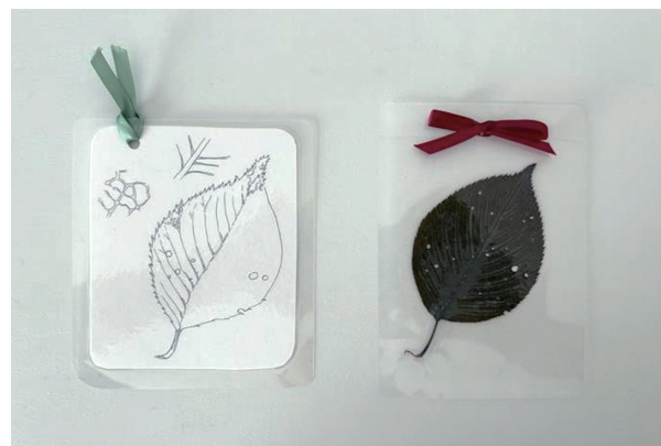
図5 成果物の一例。モデルとなった葉（右）とその描画（左）。参加者は作品とモチーフとなった葉を熱フィルムでラミネート加工し、しおりとして持ち帰った。

のものもつ虫食い跡や欠損など、個体差も含めて観察し、対象を積極的によく見ることを促した。