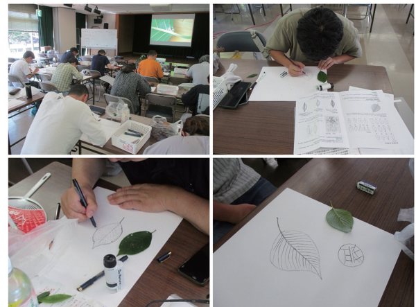
図4 葉を観察し描いているようす

三つ目に、道具の選び方について説明した。今回は太さの異なる二種類のペン（0.5mm、0.03mm）を用意し、参加者が線の太さを自由に選択できるようにした。線画により、植物の種の特徴を描き分けるといふ植物図譜の基礎的要素に加え、二種類の線の太さにより、美術的表現の要素を取り入れた。ここでいう美術的表現とは、線の使い分けによって制作者が対象をどのように捉えたかを記録することである。例えば、特に印象に残った部分は太線で力強く、詳細に観察した箇所は細線で緻密に描くなど、線の強弱が制作者のまなざしの記録となることを伝えた（図3）。さらに、それぞれの葉がもつ形の規則だけでなく、目の前の葉そ