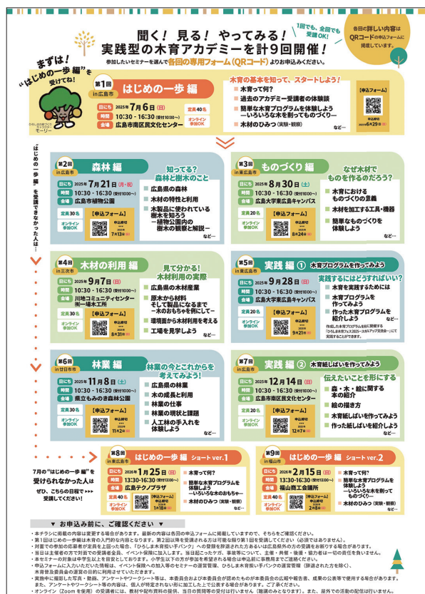
図1 「ひろしま木育アカデミー2025」は全9回からなるプログラムである

本稿では、このうち筆者が担当した描画ワークショップに焦点を当てる。当日の参加者は対面13名、オンライン2名の計15名であり、20代から80歳以上まで年齢や背景は多様であった。参加者の多くは日常的に絵を描き慣れておらず、「描くこと」に苦手意識を抱く者も少なくなかった。そこで本実践では、一般に美術教育でスケッチとして想定される写実的描画（観察した対象を陰影や質感も含めて立体的に再現しようとする描き方）とは異なる描画方法を採用した。写実的描画では、三次元の対象を二次元に転写する過程で形態の歪みが生じやすいことに加え、陰影・質感・空間の把握など複数の要素を同時に扱うことが求められる。そのため描画者にとっては、どこに着目し、どの要素を優先して描けばよいかの判断が難しく、結果として「描けなさ」を招いて苦手意識につながりやすい。本実践では植物図譜の手法を参照し、葉の輪郭および葉脈の形状を線描で捉えることに焦点を絞った。これにより、何に注目して描けばよいかを明確化し、描くことに苦手意識をもつ参加者であっても、描画を通して葉の形を積極的に探究し関心を深められるよう工夫した。